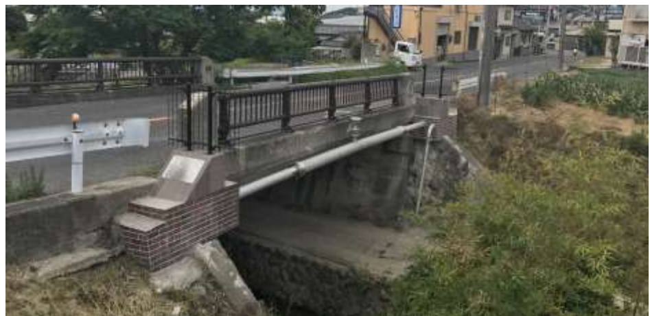
【太子町山田橋水管橋架替工事での設置後の完成写真】