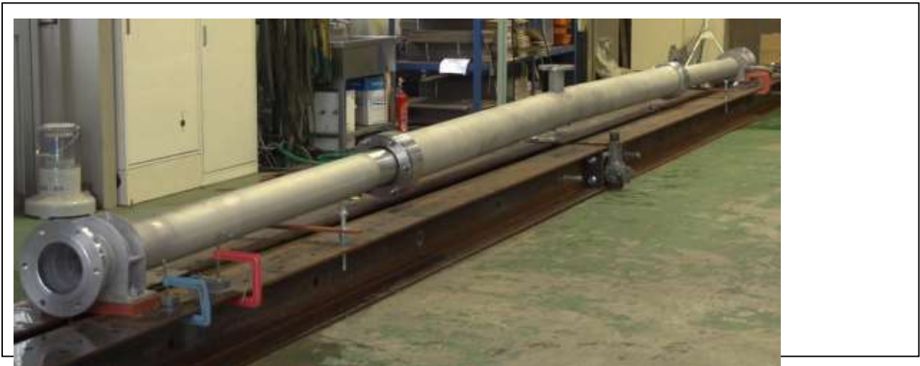
【NSフリースパン水管橋®の全体写真】